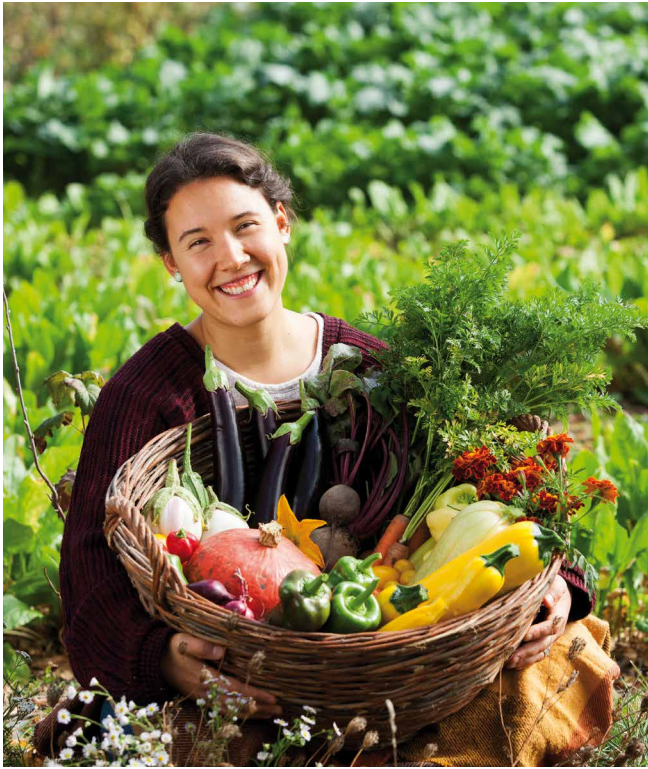
Bio-Lebensmittel ohne Pestizide