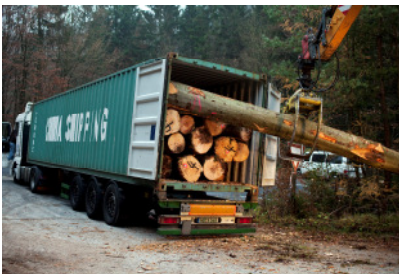
Buchen aus dem Spessart für den Export nach China

Ungefähr jede zweite Buche, die aus Deutschland exportiert wird, landet in China. 2 Ein Teil der dort gefertigten Holzprodukte wird dann wieder nach Deutschland zurück importiert.